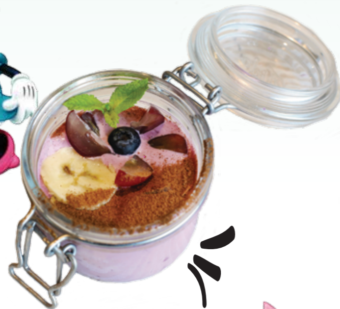
ДОМАШНИЙ ЙОГУРТ .- 130 200 гр