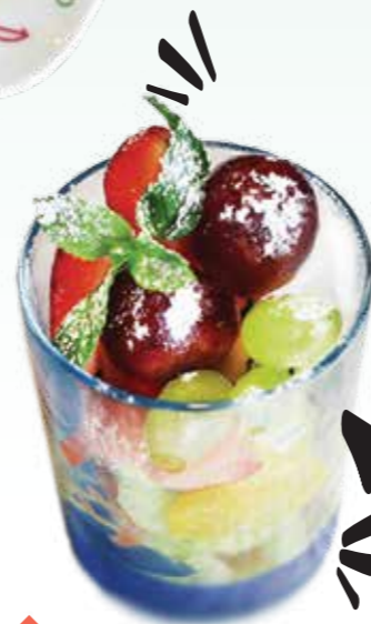
ФРУКТЫ .- 110 155/20 гр