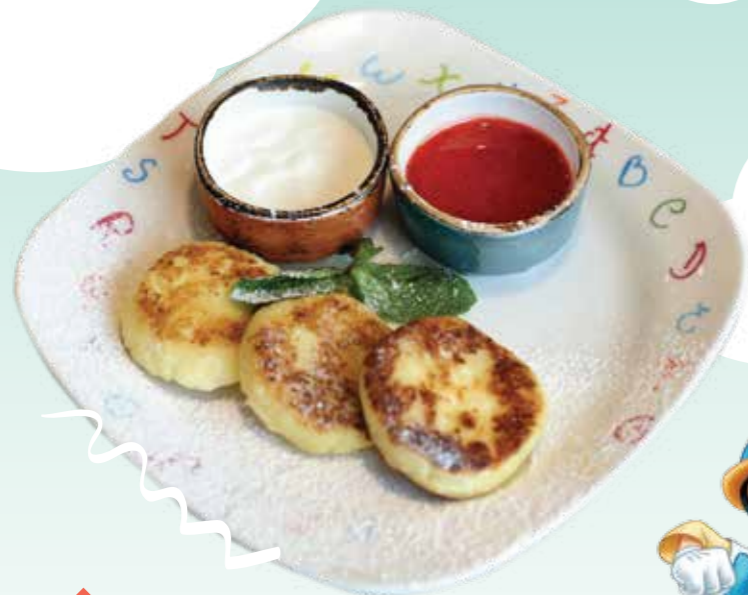
СЫРНИКИ .- 140 120/30/30 гр со сметанкой и клубничным соусом