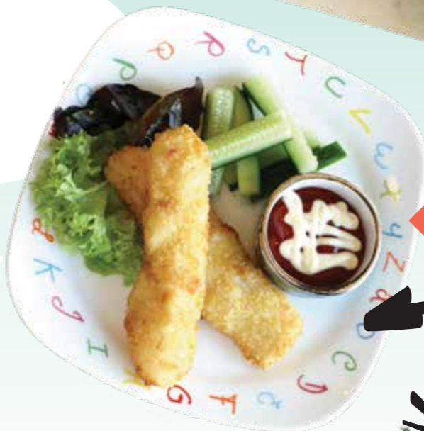
РЫБНЫЕ ПАЛОЧКИ .- 180 110/40/30 гр