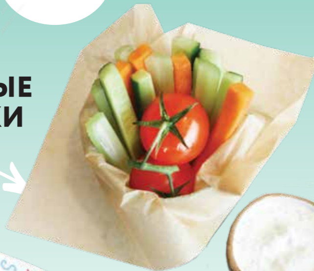
ОВОЩНЫЕ ПАЛОЧКИ .- 100 150/30 гр