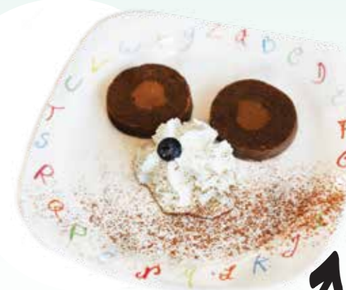
ПИРОЖНОЕ "КАРТОШКА" .- 100 100/10 гр