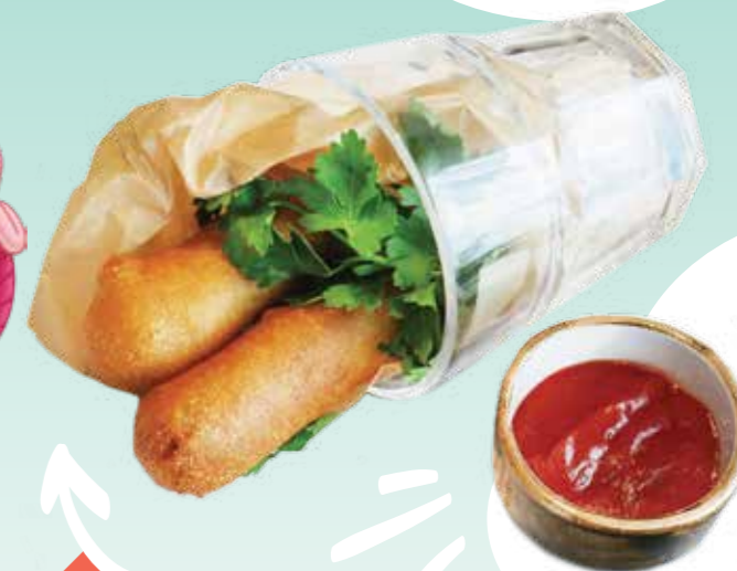
КОРН-ДОГ .- 95 85/30 гр